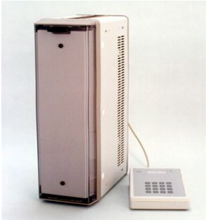
オートキャリブレーション機能